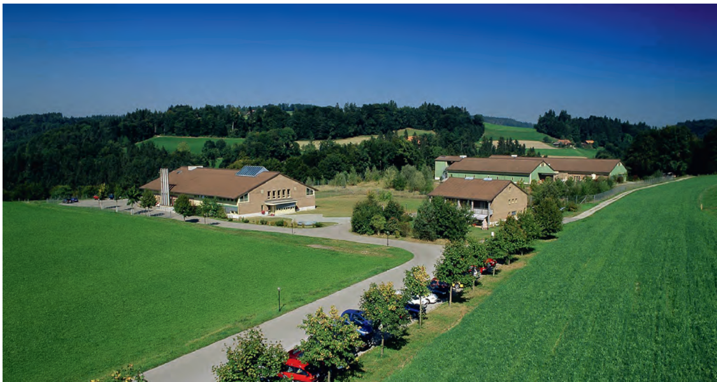
Luftaufnahme des Instituts für Virologie und Immunologie (IVI), einer dem BLV unterstellten Forschungsanstalt. Das IVI ist das Schweizer Referenzlabor für Diagnose, Überwachung und Kontrolle hochansteckender Tierseuchen.

dass eine Harmonisierung der Umsetzung in den Kantonen möglich ist und entsprechend auch erfolgt. Auf diesem Gebiet haben wir wie gesagt in den letzten zwanzig Jahren grosse Anstrengungen unternommen und in der Folge auch grosse Fortschritte erzielt. Aber denken Sie daran: Die Schweiz ist ein föderalistischer Staat. Die Kantone haben relativ viele Kompetenzen.