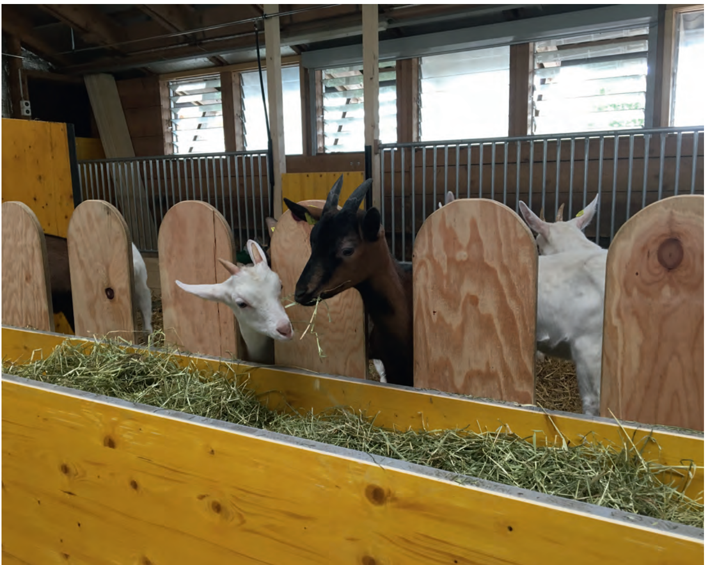
Blick in einen Versuchsstall im Zentrum für tiergerechte Haltung «Wiederkäuer und Schweine», einer Aussenstation des BLV in Tänikon.