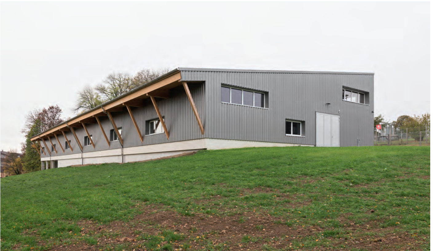
Das neue Gebäude beim Aviforum in Zollikofen – eine der Aussenstellen des Bundesamtes für Lebensmittelsicherheit und Veterinärwesen (BLV). Zollikofen ist eine der zwei Aussenstationen des BLV, die im Bereich Tierschutz tätig sind. In Zollikofen geht es um die tiergerechte Haltung von Geflügel und Kaninchen.

zehn bis fünfzehn Autominuten von hier entfernt. Es ist ein Forschungsinstitut mit einem Hochsicherheitslabor, das seit fast dreissig Jahren dort angesiedelt ist.