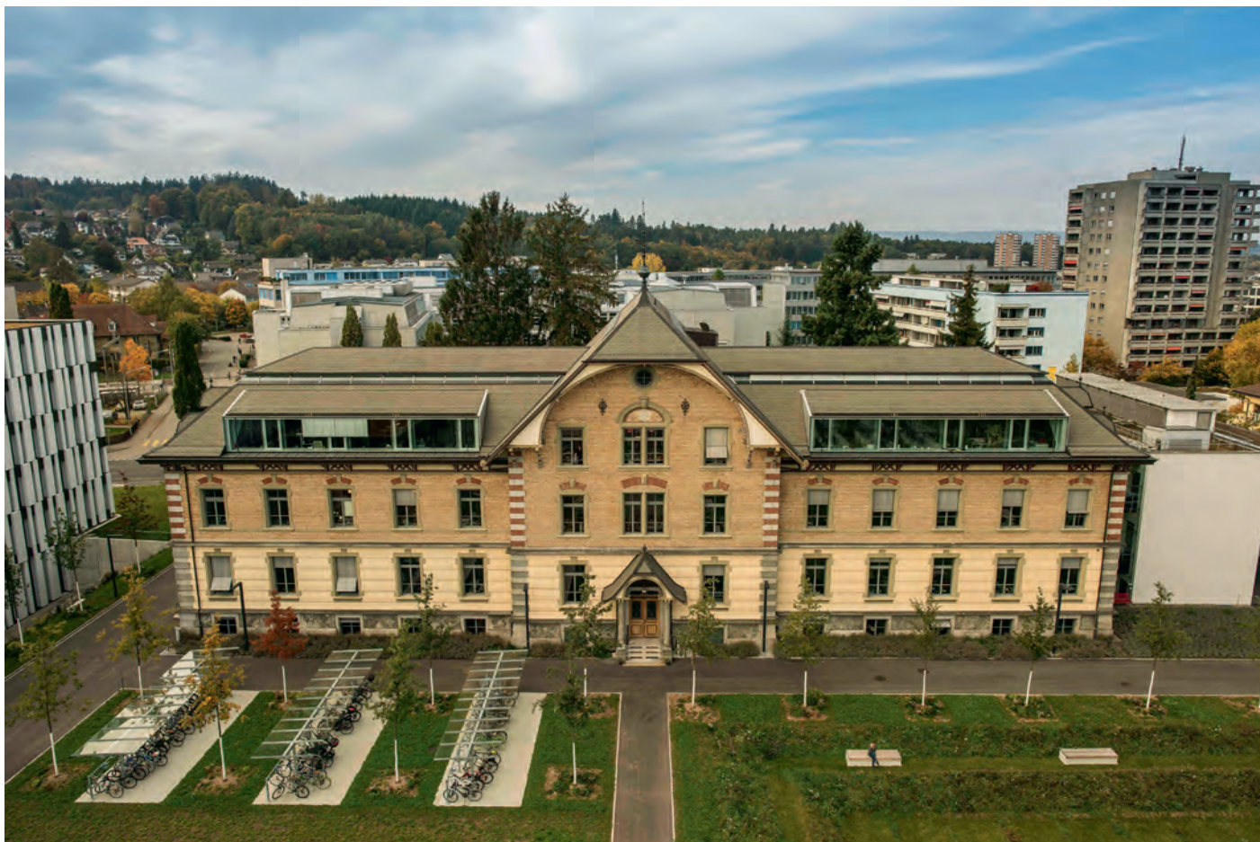
Das Gebäude des Bundesamtes für Lebensmittelsicherheit und Veterinärwesen (BLV) befindet sich auf dem Campus Liebefeld in Köniz bei Bern.

ist. Beide Ämter sind hier auf dem Campus Liebefeld beheimatet. Mit dem BAG verbinden uns diverse Themen. Dazu gehören unter anderen die bundesrätliche Strategie Antibiotikaresistenzen (StAR) und die Bekämpfung von Zoonosen, also von Krankheiten, die vom Tier auf den Menschen und umgekehrt übertragen werden können.